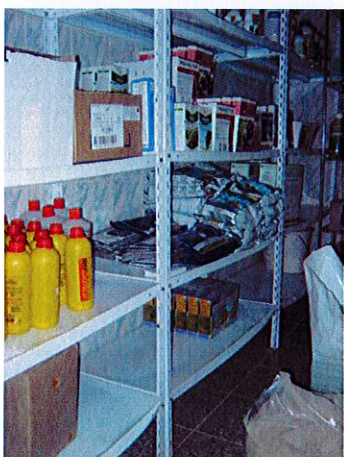
spremište za otrove